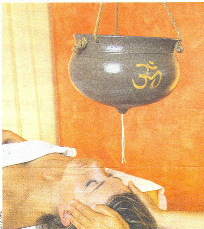
Typische Ayurveda-Behandlung: Öl wird langsam auf die Stirne gegossen.

Grundsätzen wie: nur bei Hunger essen, sich nicht ganz satt essen, frische Lebensmittel verwenden, die Hauptmahlzeit mittags, nie in